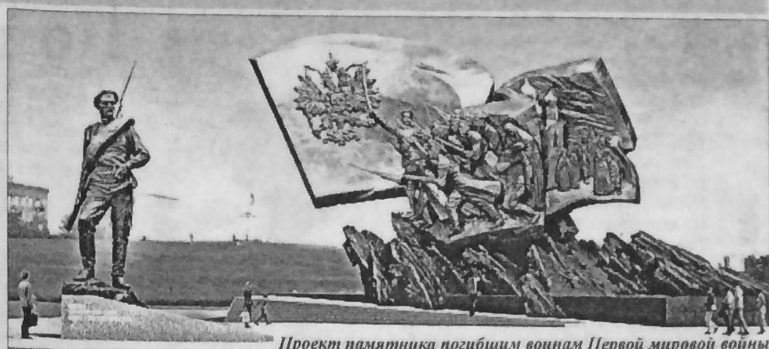
Проект памятника погибшим воинам Первой мировой войны