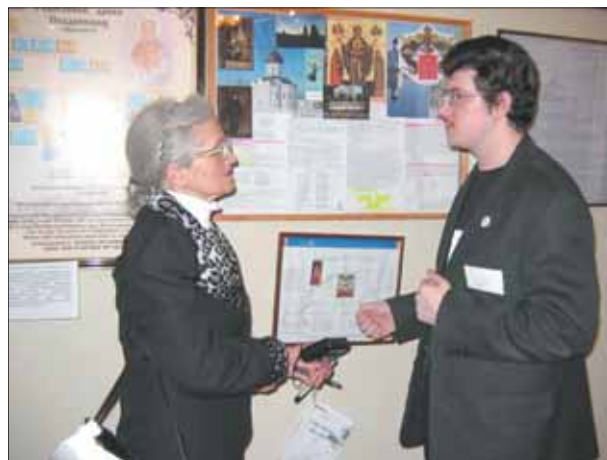
Самая пожилая и самый молодой участники выставки в Ярославле обнаружили общие корни

ность показать школьникам, "с чего начинается Родина", дать толчок каждому посетителю начать свои генеалогические изыскания, подсказать ему, что делать и с чего начать. Это общение единомышленников, стремящихся поделиться своими успехами и рассказать о трудностях поиска.