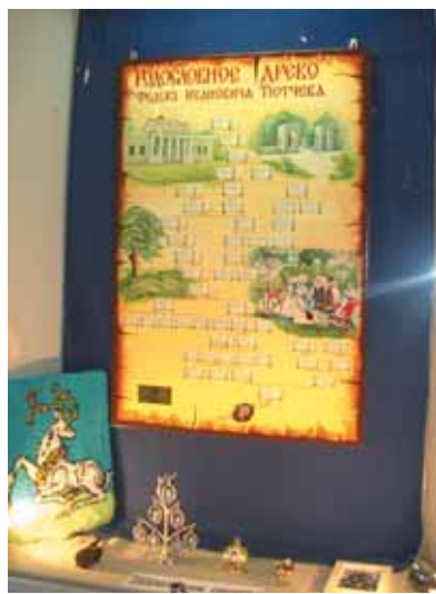
Древо Ф.И. Тютчева