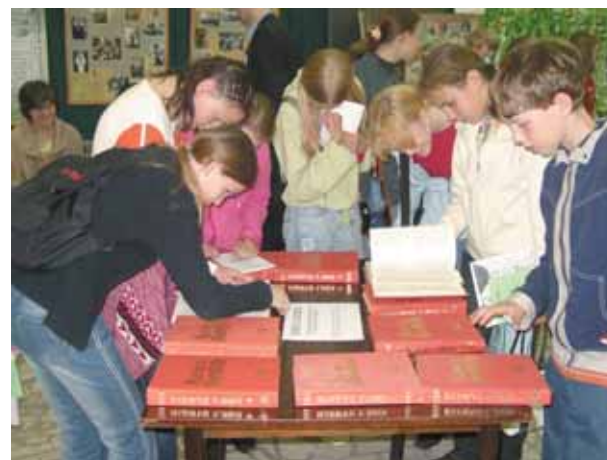
Неподдельный интерес у школьников вызывают Книги памяти погибших в Великой Отечественной...