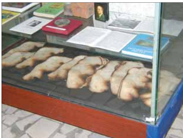
Было время, когда ради безопасности люди сжигали родословные книги...