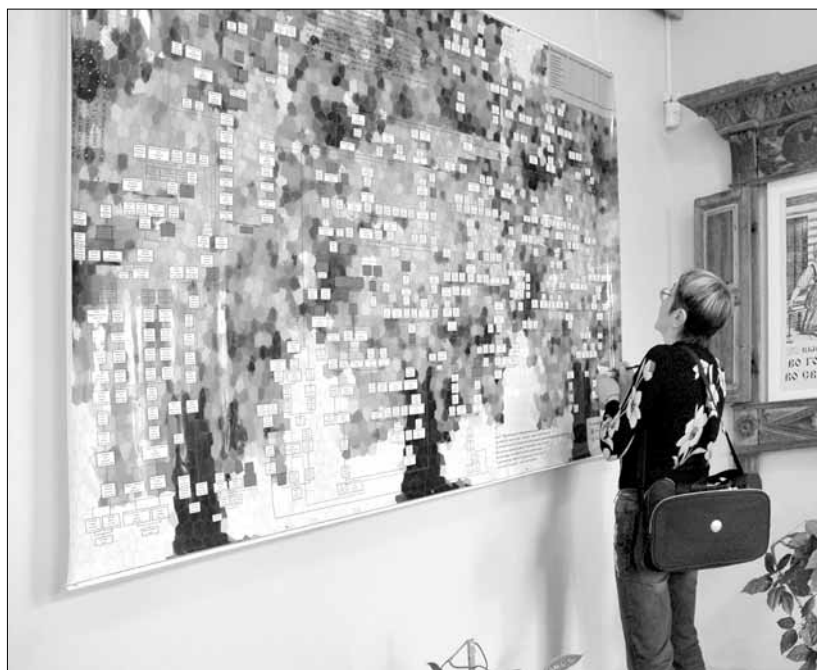
Древо свойственных связей на выставке в Ярославле