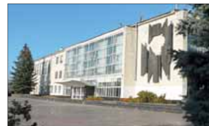
Дом культуры г. Углича

С 22 января по 29 февраля в Доме Культуры древнего Углича пройдет VI Всероссийская генеалогическая выставка. Ее проводит Союз Возрождения Родословных Традиций (г. Москва) и