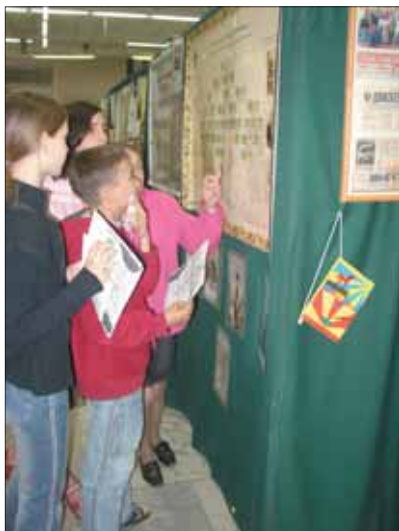
Самые заинтересованные - дети...