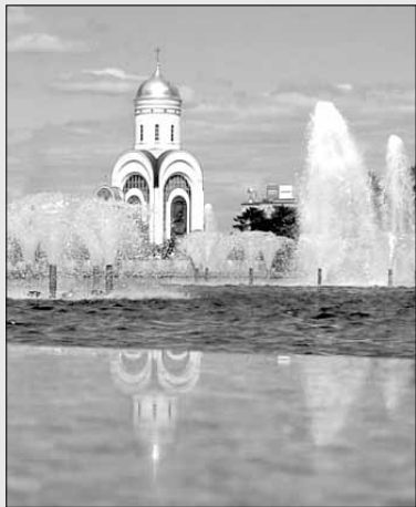
На Поклонной горе

Открыли электронную версию. Не моя фамилия. Через другую букву. А тот, который с правильной буквой, явно не мой.