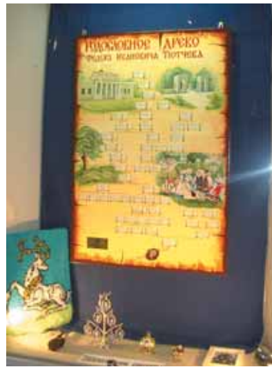
Древо Ф.И. Тютчева