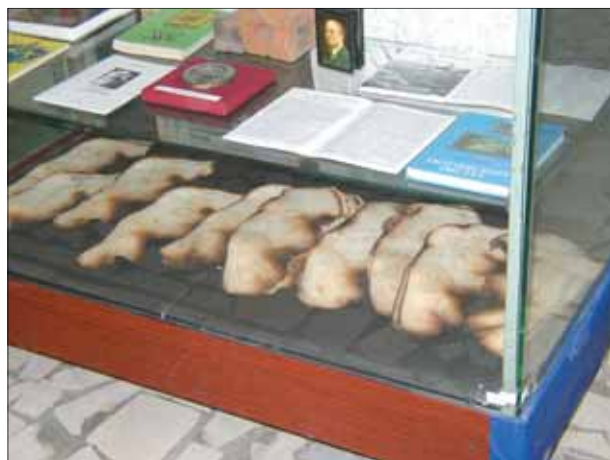
Было время, когда ради безопасности люди сжигали родословные книги...