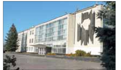
Дом культуры г. Углича

С 22 января по 29 февраля в Доме Культуры древнего Углича пройдет VI Всероссийская генеалогическая выставка. Ее проводит Союз Возрождения Родословных Традиций (г. Москва) и