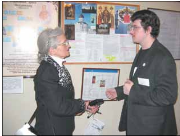
Самая пожилая и самый молодой участники выставки в Ярославле обнаружили общие корни

ность показать школьникам, "с чего начинается Родина", дать толчок каждому посетителю начать свои генеалогические изыскания, подсказать ему, что делать и с чего начать. Это общение единомышленников, стремящихся поделиться своими успехами и рассказать о трудностях поиска.