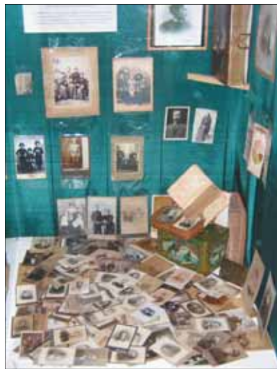
Лица ушедших эпох...