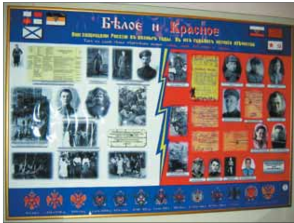
В судьбах одной семьи отразилась трагедия всей страны...

Каждая выставка - это не просто событие. Это возможность рассказать о своем поиске, о неожиданных находках. Это шанс найти родственников среди посетителей и других участников мероприятия. Это советы специалистов и опытных товарищей по поиску своих корней. Это возмож-