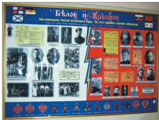
В судьбах одной семьи отразилась трагедия всей страны...

Каждая выставка - это не просто событие. Это возможность рассказать о своем поиске, о неожиданных находках. Это шанс найти родственников среди посетителей и других участников мероприятия. Это советы специалистов и опытных товарищей по поиску своих корней. Это возмож-