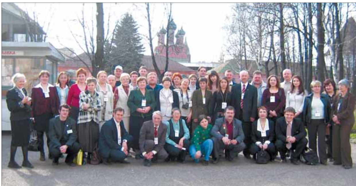
Организаторы и участники IV Всероссийской генеалогической выставки в Ярославле