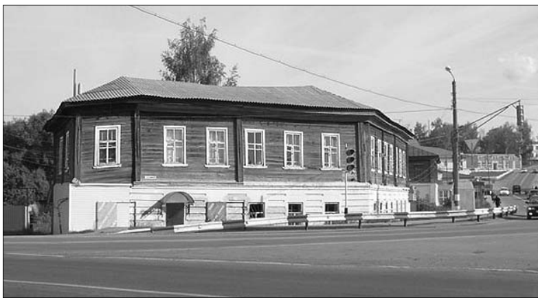
«Пушкинский» трактир в Лукоянове

Было немало заинтересовавшихся, кто хотел бы составить свое древо, но до этого времени даже не предполагал, что это реально. Многие до сих пор считали, что больше, чем им удалось узнать о предках от родственников, узнать невозможно.