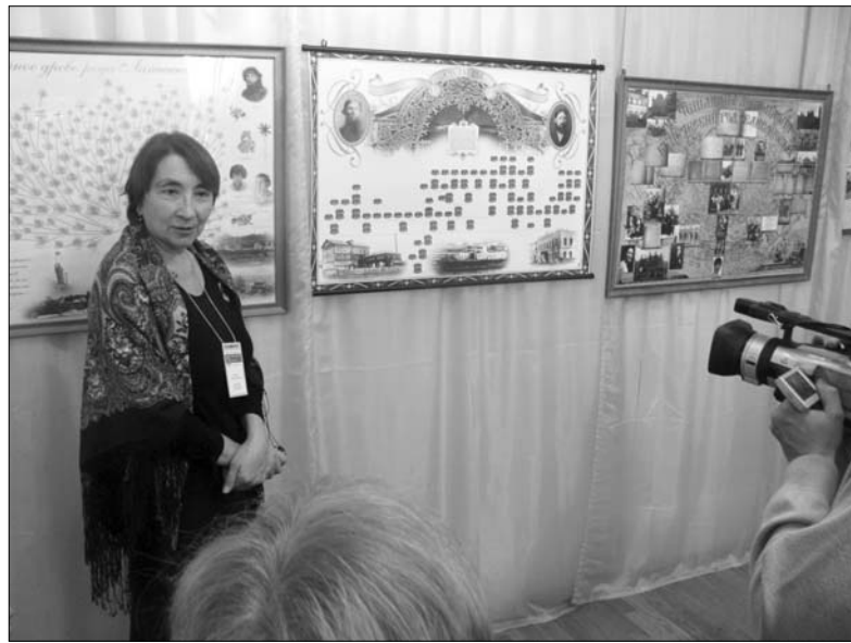
Экскурсия по выставке

Немалый интерес у посетителей вызвал плакат о происхождении фамилий. С удовольствием присутствующие рассматривали детские работы победителей областных конкурсов «Моя семья в истории страны» и «Наша родословная».