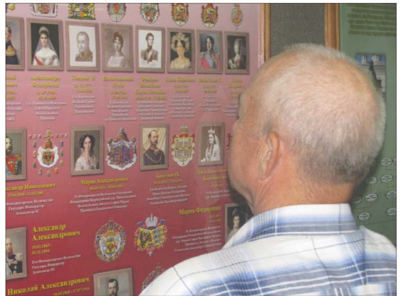
Дерево предков императора Николая II