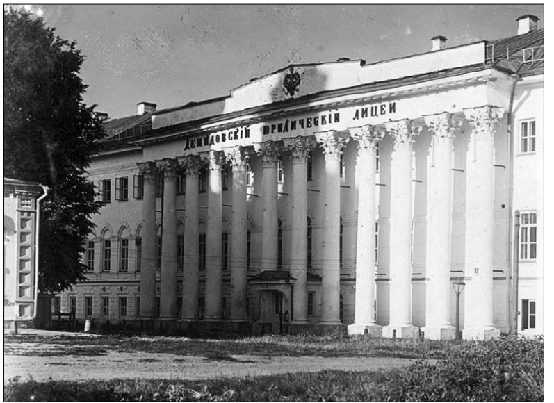
Демидовский юридический лицей