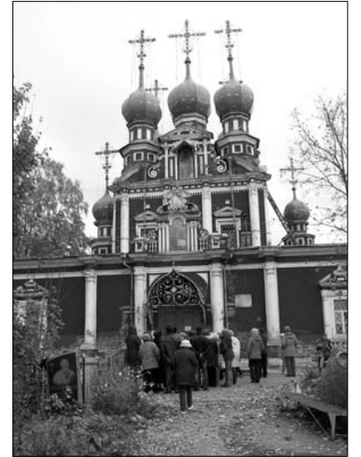
На экскурсии в Устюжне