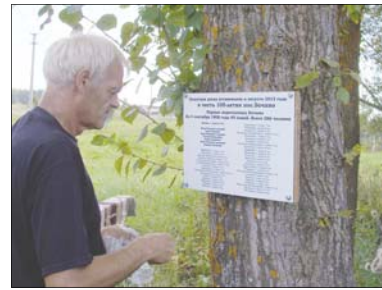
Установка памятной доски

глашал широкий комплекс мер по разрушению коллективного землевладения сельского общества и созданию класса крестьян — полноправных собственников земли. Похоже, Петр Бочин знал об указе, и поэтому обратился с прошением.