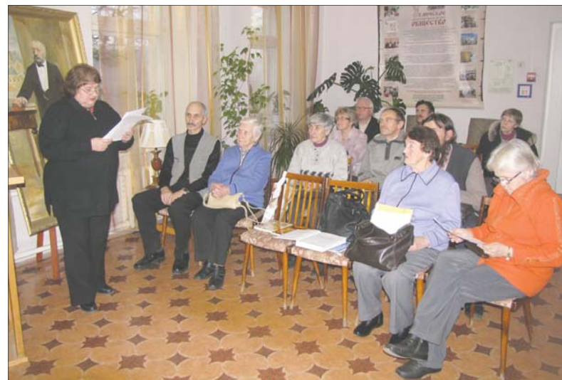
На собрании Угличского родословно-краеведческого общества

Угличскому родословно-краеведческому обществу - 5 лет