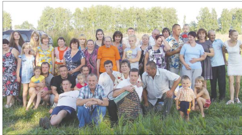
Приехавшие на праздник бывшие жители Бочино и их потомки

Поселок развивался. Подняв целину, построив добротные дома