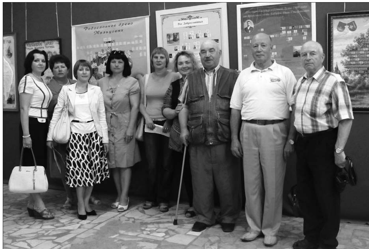
Делегация из г. Дятьково на XI Всероссийской генеалогической выставке в Брянске