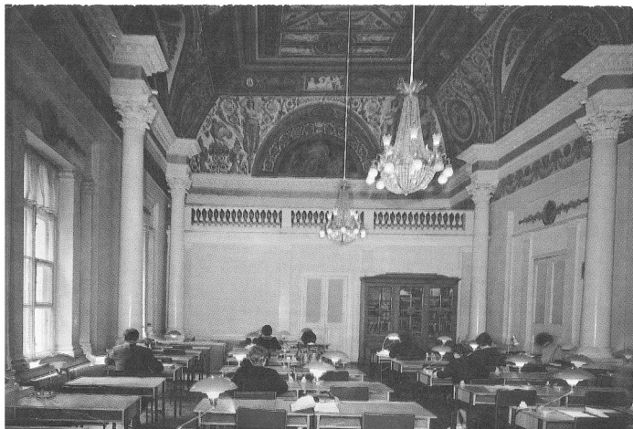
Читальный зал РГИА в середине 1990-х годов