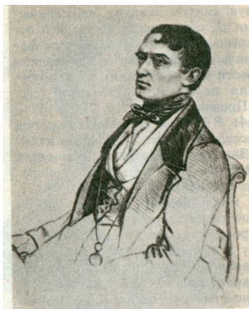
Портрет работы неизвестного автора. Возможно, начало 1840-х гг.

Некоторые литературоведы полагают, что Долгоруков был членом «кружка шестнадцати», в который входил и М.Ю. Лермонтов. Современники рассказывали, что в этом кружке достаточно свободно рассуждали о политике 7 .