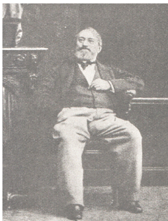
Князь П.В. Долгоруков в эмиграции. Фотография. Возможно, 1860-е гг.

Политические проекты князя Долгорукова не были реализованы. Они не встретили поддержки русского общества. И все же мы видим, что на более позднем этапе русской истории все вопросы, о которых говорил князь, обострились до такой степени, что их уже нельзя было игнорировать. В 1905 г. Россия получила конституцию (пусть даже и «куцую»); в 1915 г. Россия пообещала Польше независимость, но было уже поздно; в середине 1917 г. в Москве собрался Всероссийский православный собор, занимавшийся церковной реформой; незадолго до Февральской революции в правительстве обсуждался вопрос о замене губернского административного деления – областным.