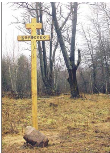
Памятный крест на месте бывшей деревни Борисово

Никакая власть не может лишить людей малой Родины,