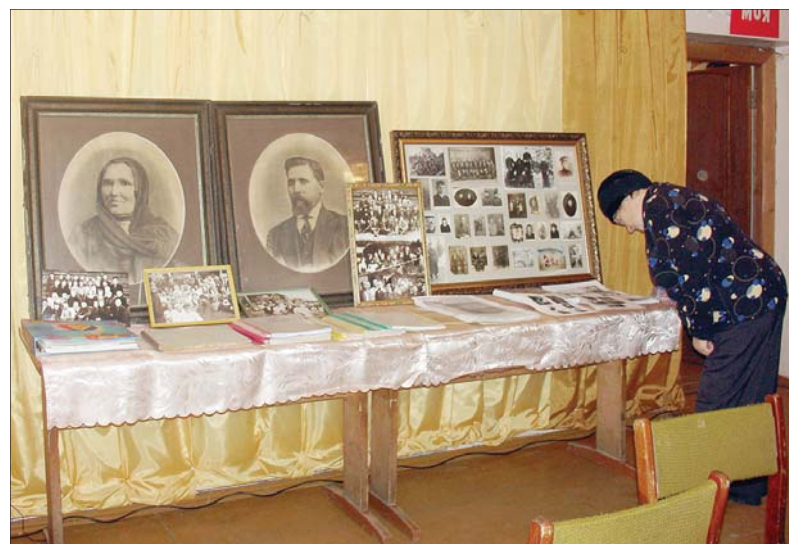
Семейные фотографии и альбомы, принесенные на встречу

Из рассказов старожиллов знаю, что в деревне Борисово все жили очень дружно. Доказательство тому – ни одного доноса в годы репрессий.