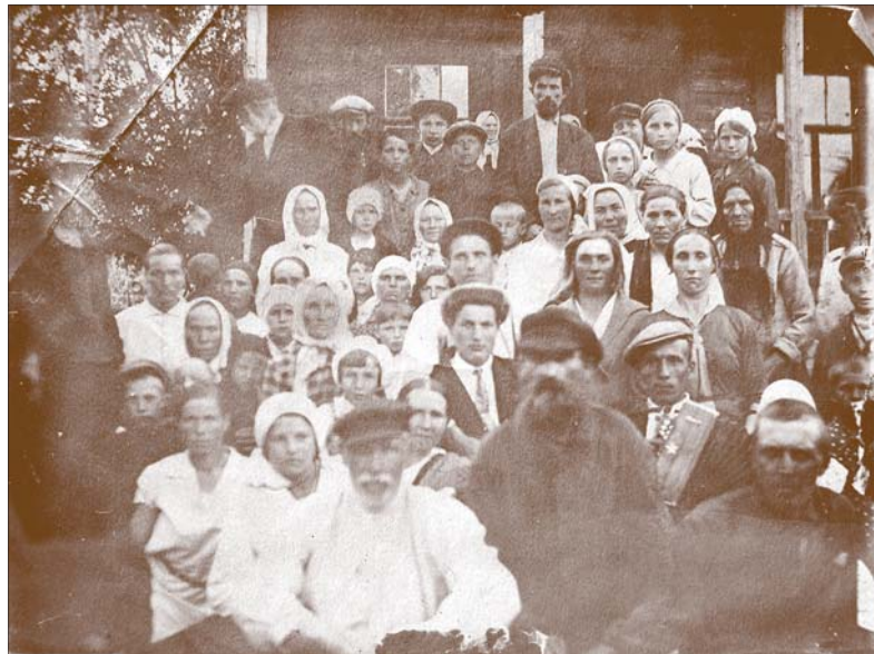
Общая фотография жителей деревни, сделанная в 1937 году