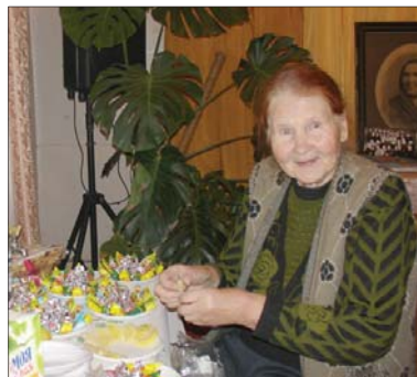
В ожидании праздника

Атмосфера на встрече была удивительно теплой, как будто члены большой дружной семьи