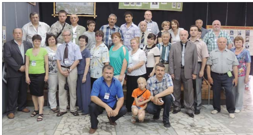
На XI Всероссийской генеалогической выставке Союза Возрождения Родословных Традиций. Брянск, 2013