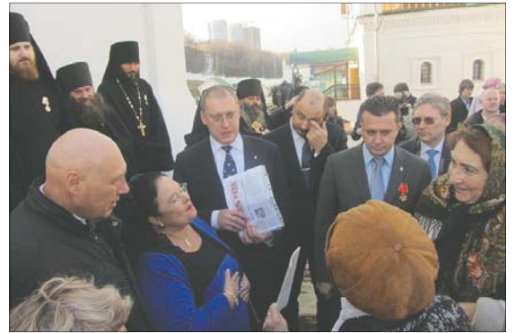
Во время вручения нашей газеты «Память Рода» и диска с фильмом о Балахне Великой княгине Марии Владимировне