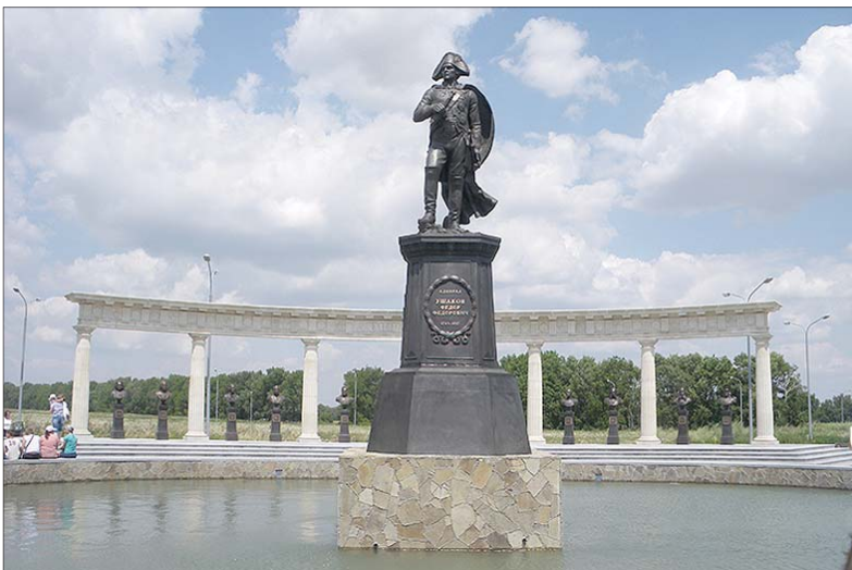
Памятник адмиралу Ушакову