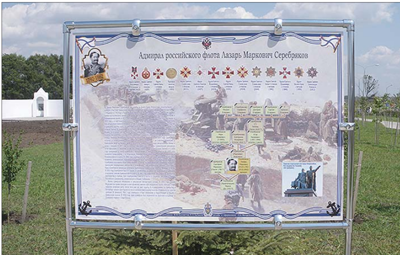
Один из тринадцати плакатов СВРТ