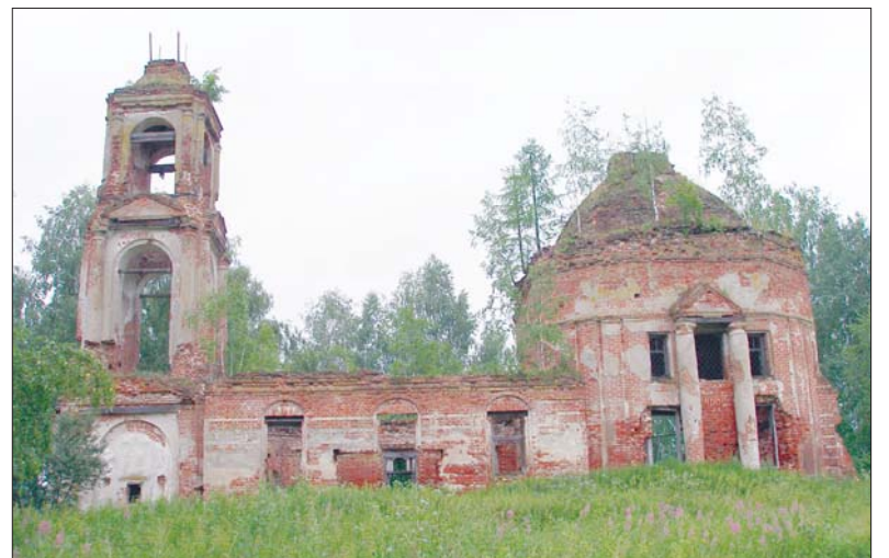
В настоящее время в Игнатово сохранилось кладбище и остов Богородице-Рождественской церкви

В конце поездки я любовался окрестностями Галича и Галичским озером с горы Балчуг. Так,