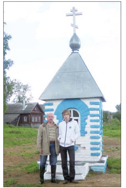
Автор с сыном у часовни

Поэт Державин, который был многим обязан Бибилову, написал оду на его смерть. Там есть такие строки: