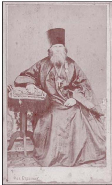
Иаков Семенович Каллистов

гражден орденом Св. Анны 3-й степени. 17 июля 1862 г. возведен в сан протоиерея. Более 50 лет Яков Семенович священствовал при одной церкви и 40 лет был в должности благочинного.