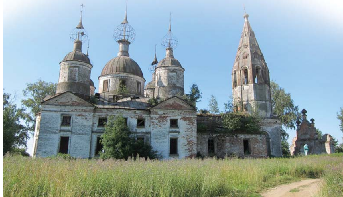
Воскресенская церковь села Остров. Фото 2011 года