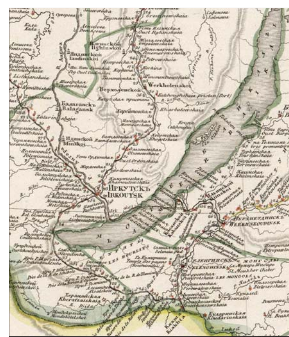
Иркутск и Кяхта в 18 веке