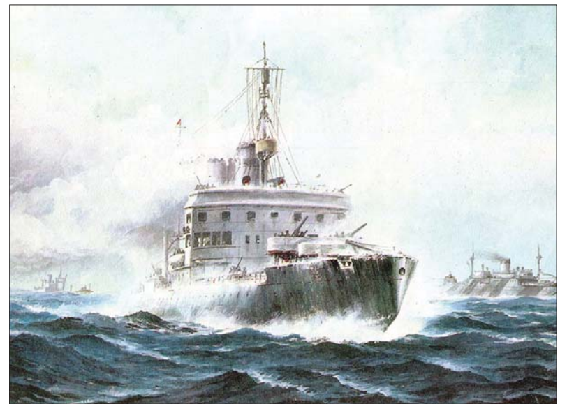
Крейсер «Анастас Микоян»

После этого дед воевал на подводной лодке, участвовал в еще одном полукругосветном переходе подводных лодок с Дальнего